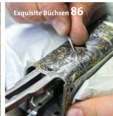
Exquisite Büchsen 86