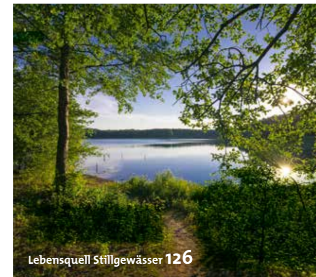
Lebensquell Stillgewässer 126