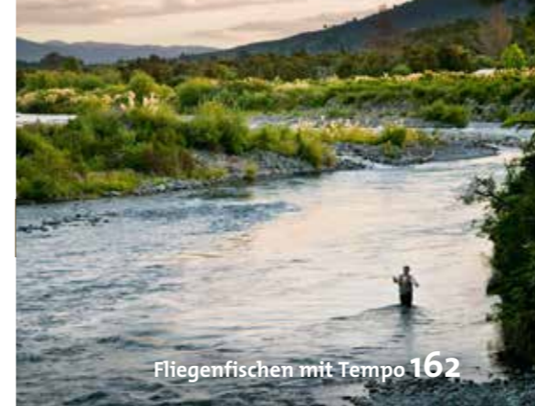
Fliegenfischen mit Tempo 162