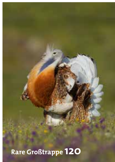
Rare Großtrappe 120