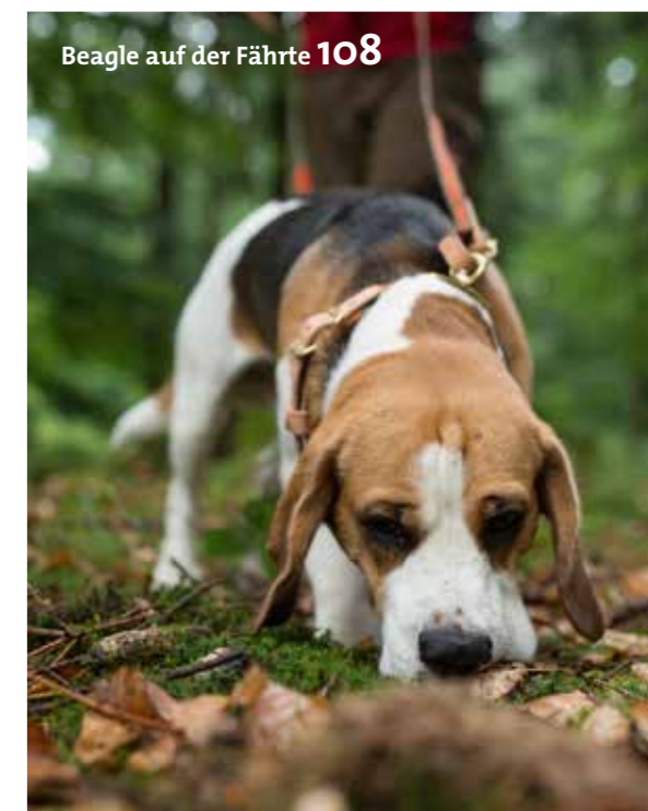
Beagle auf der Fährte 108