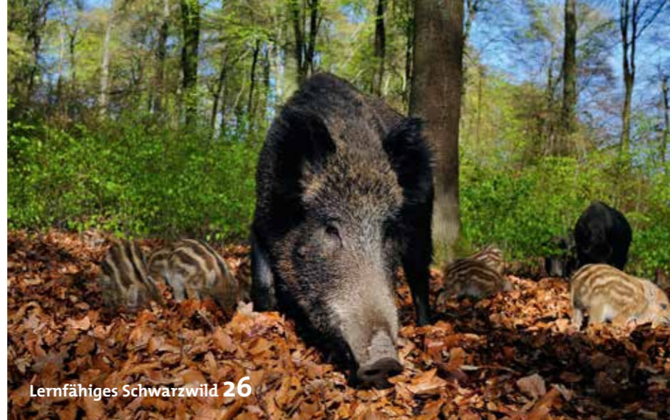
Lernfähiges Schwarzwild 26