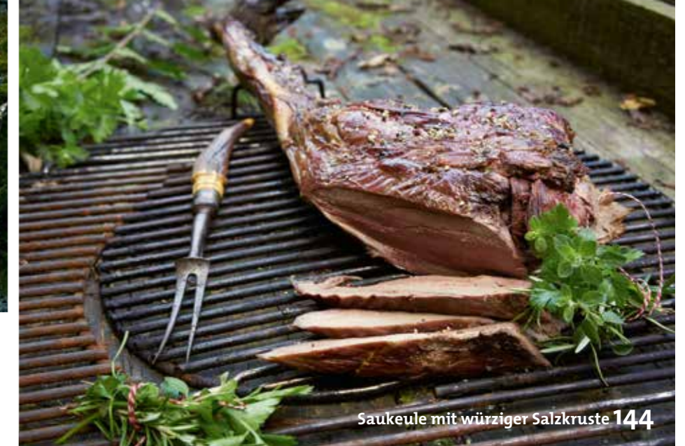
Saukeule mit würziger Salzkruste 144