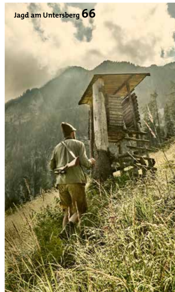
Jagd am Untersberg 66