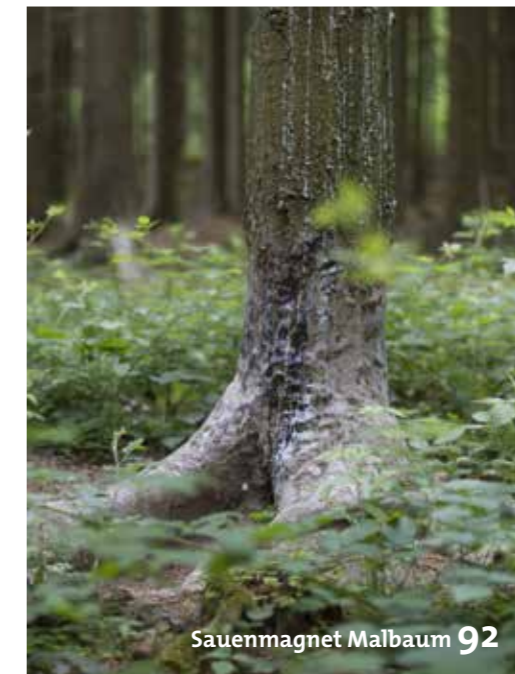
Sauenmagnet Malbaum 92