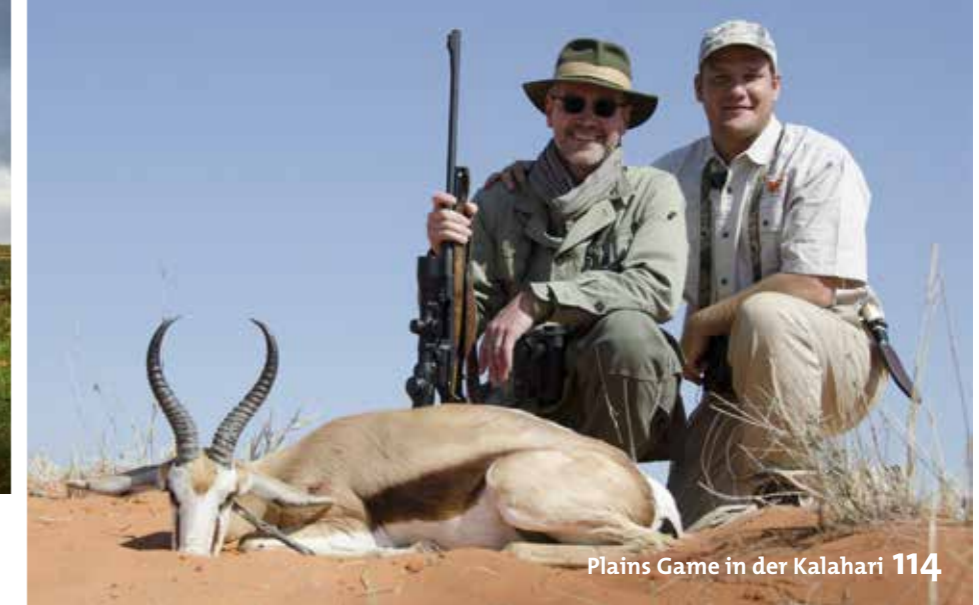
Plains Game in der Kalahari 114