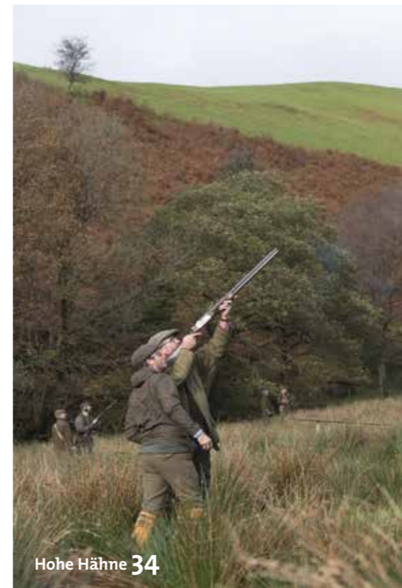
Hohe Hähne 34

Wie wir unsere vierbeinigen Gefährten besser verstehen