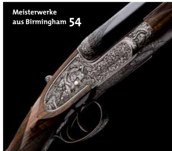
Meisterwerke aus Birmingham 54