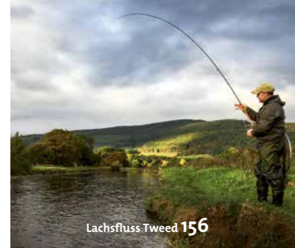
Lachsfluss Tweed 156