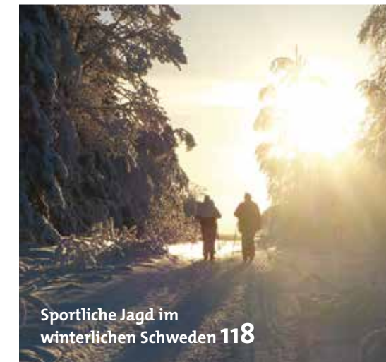
Sportliche Jagd im winterlichen Schweden 118