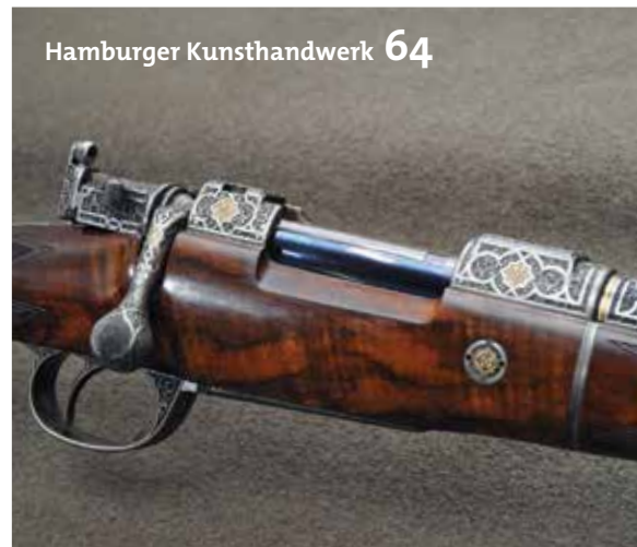
Hamburger Kunsthandwerk 64