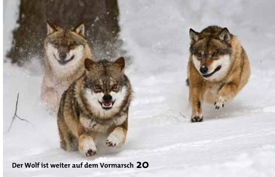
Der Wolf ist weiter auf dem Vormarsch 20