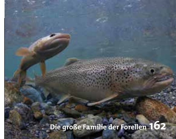
Die große Familie der Forellen 162