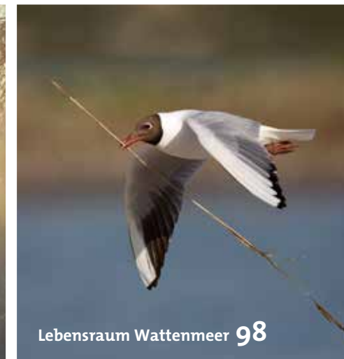
Lebensraum Wattenmeer 98