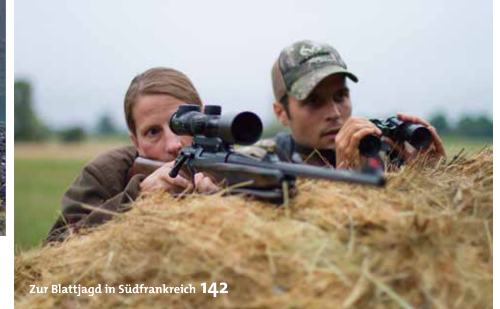
Zur Blattjagd in Südfrankreich 142