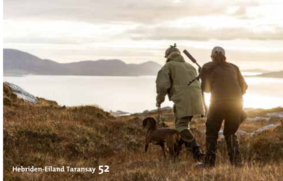
Hebriden-Eiland Taransay 52