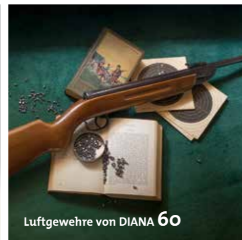
Luftgewehre von DIANA 60