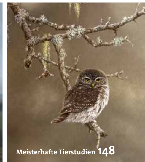
Meisterhafte Tierstudien 148