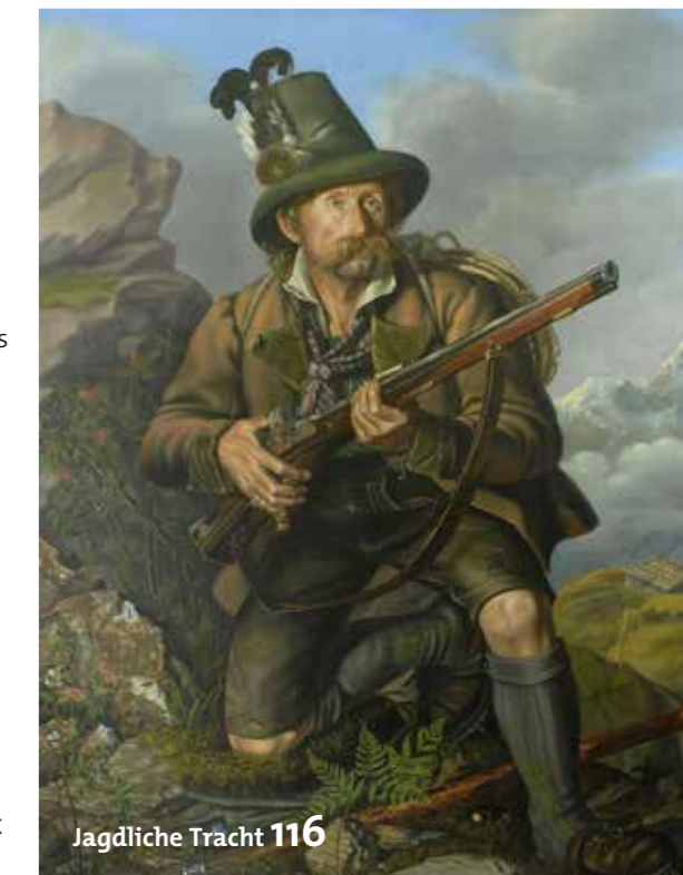
Jagdliche Tracht 116