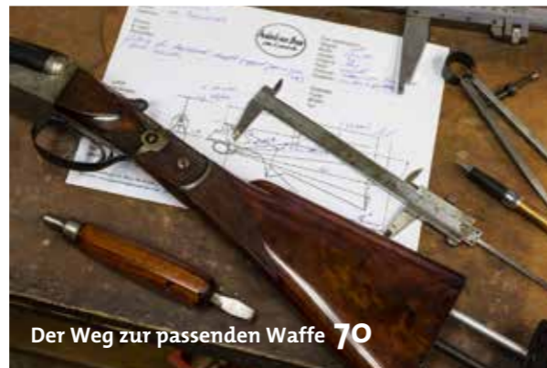
Der Weg zur passenden Waffe 70