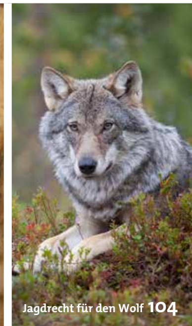
Jagdrecht für den Wolf 104