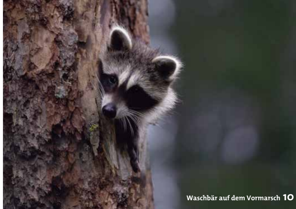
Waschbär auf dem Vormarsch 10

Wie der niederländische Gunfitter Frederik van Breen die Zielgenauigkeit verbessert