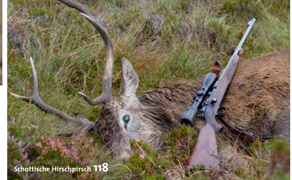
Schottische Hirschpirsch 118

Tipps und Tricks für Kurzgebratenes von Hirsch, Reh und Schwarzkittel