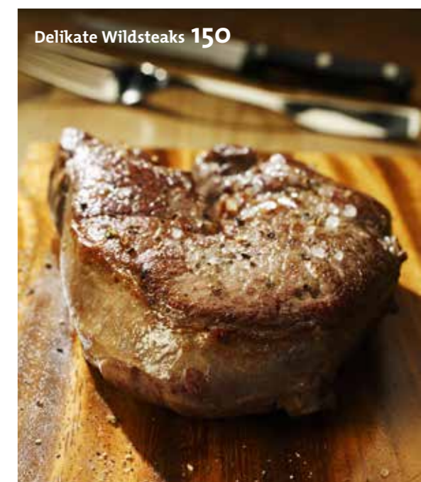
Delikate Wildsteaks 150