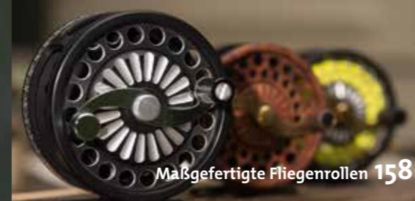
Maßgefertigte Fliegenrollen 158