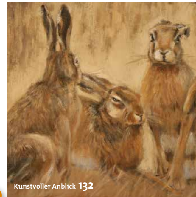
Kunstvoller Anblick 132