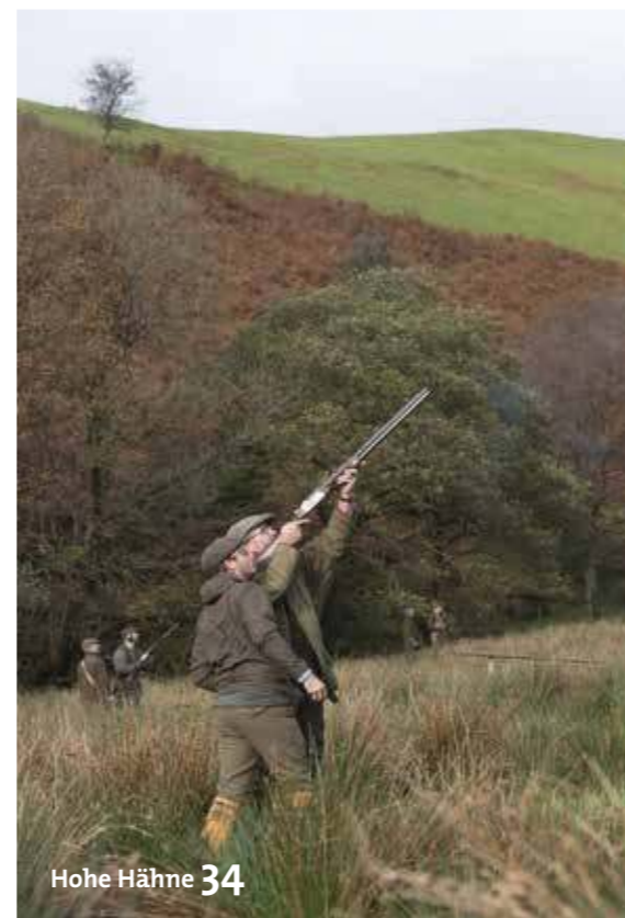
Hohe Hähne 34