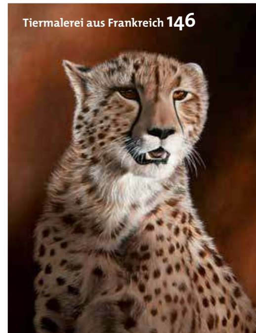
Tiermalerei aus Frankreich 146