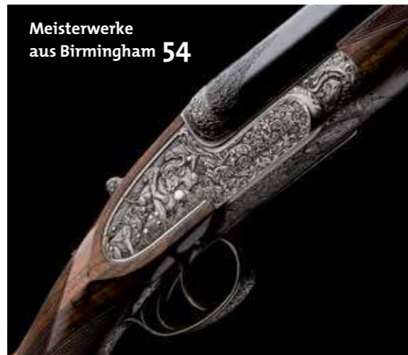
Meisterwerke aus Birmingham 54