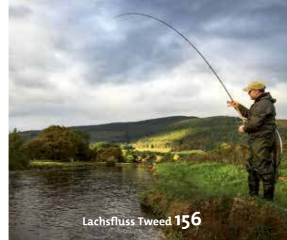
Lachsfluss Tweed 156