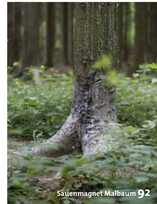
Sauenmagnet Malbaum 92