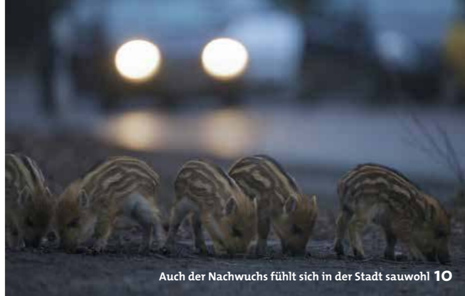
Auch der Nachwuchs fühlt sich in der Stadt sauwohl 10