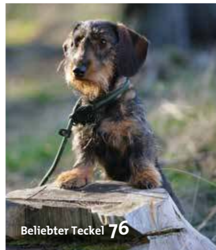
Beliebter Teckel 76