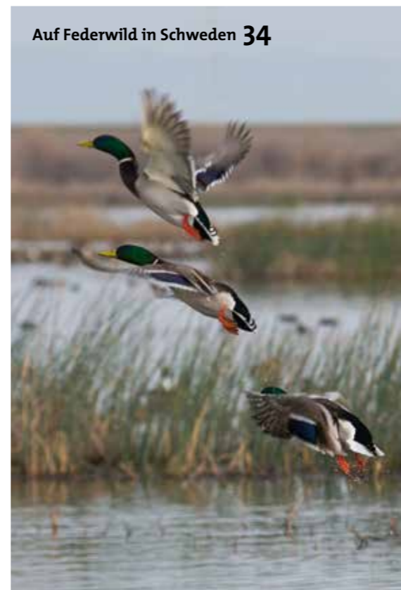
Auf Federwild in Schweden 34