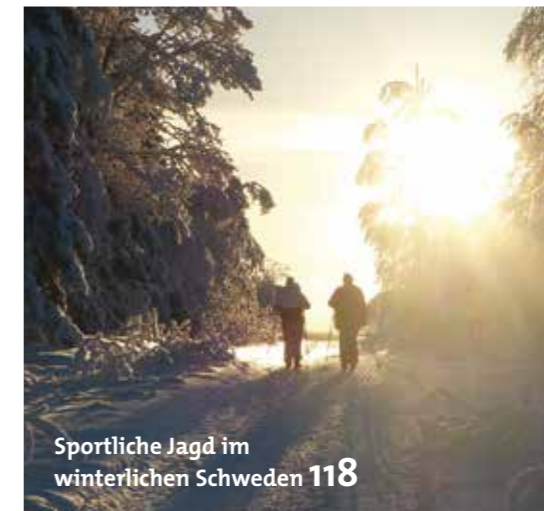
Sportliche Jagd im winterlichen Schweden 118