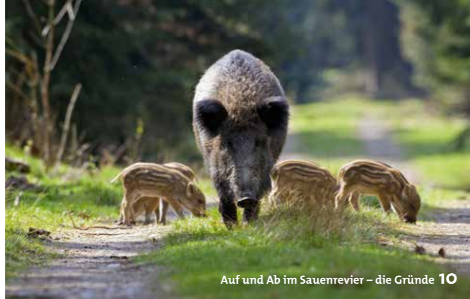
Auf und Ab im Sauenrevier – die Gründe 10