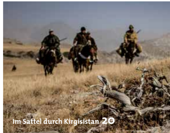
Im Sattel durch Kirgisistan 20