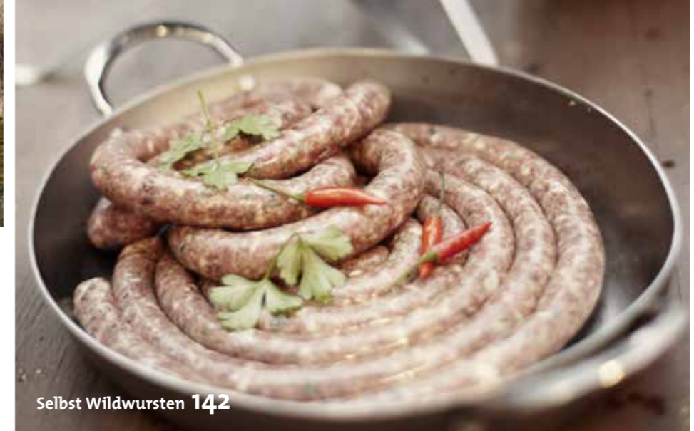
Selbst Wildwürsten 142