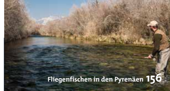
Fliegenfischen in den Pyrenäen 156