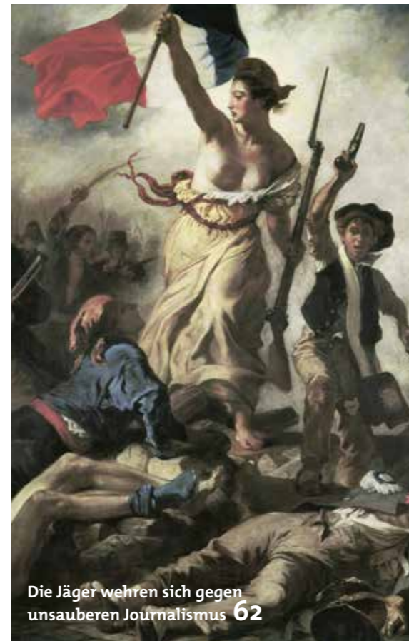
Die Jäger wehren sich gegen unsauberen Journalismus 62