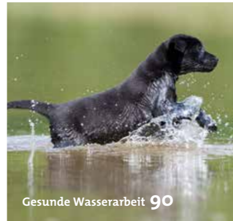
Gesunde Wasserarbeit 90