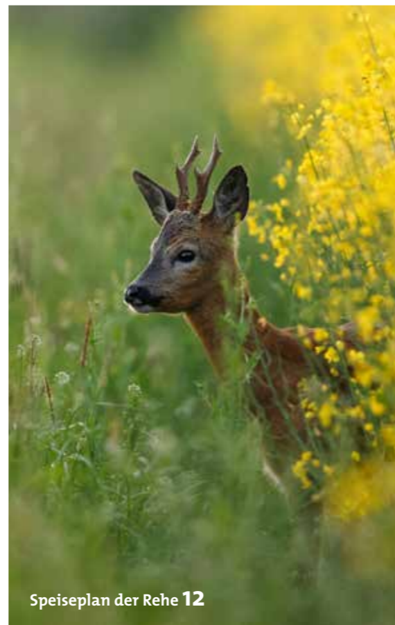
Speiseplan der Rehe 12