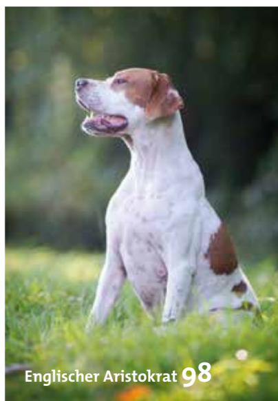
Englischer Aristokrat 98