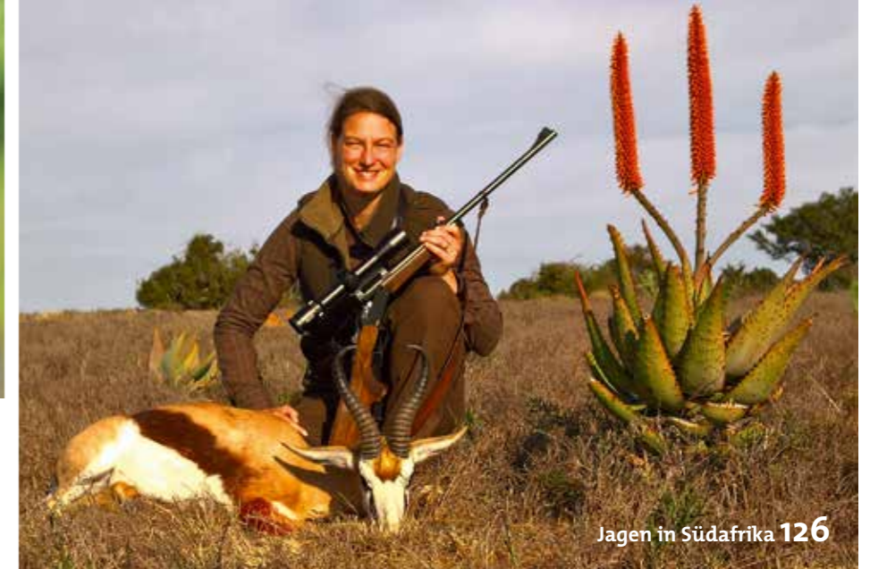
Jagen in Südafrika 126