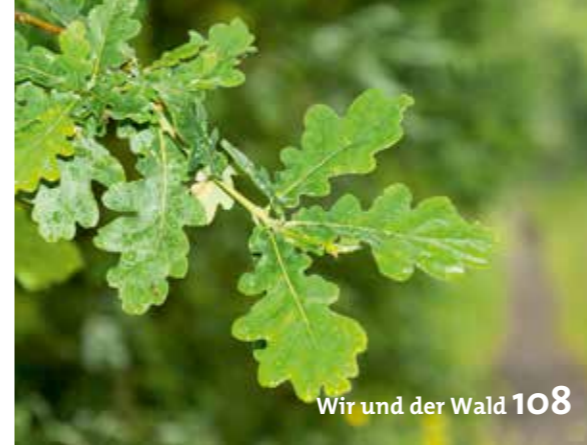
Wir und der Wald 108