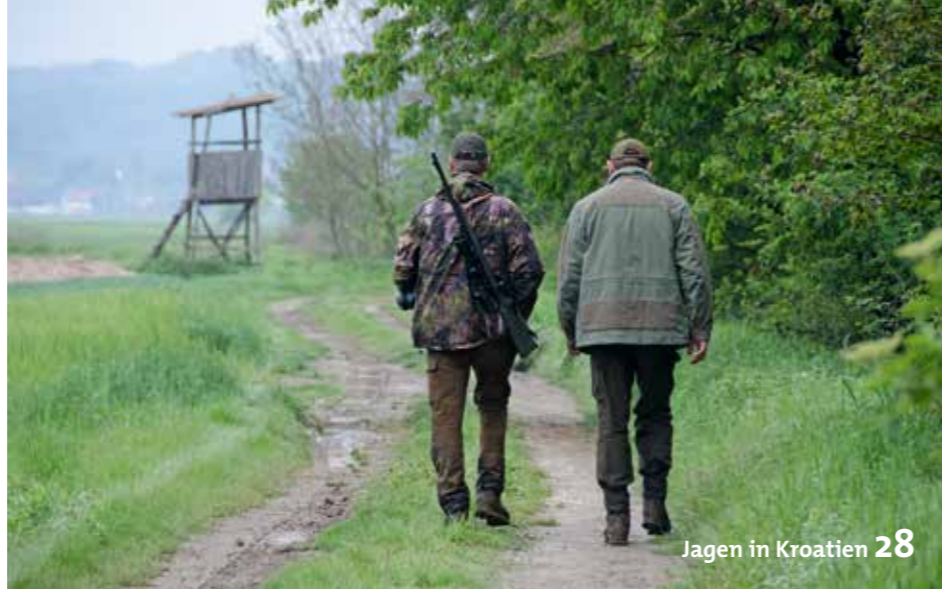
Jagen in Kroatien 28