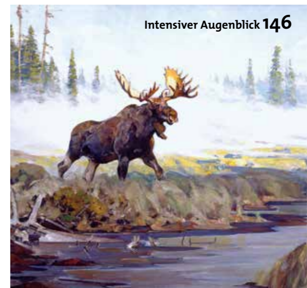
Intensiver Augenblick 146