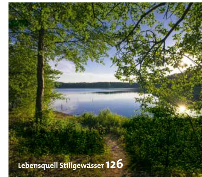
Lebensquell Stillgewässer 126