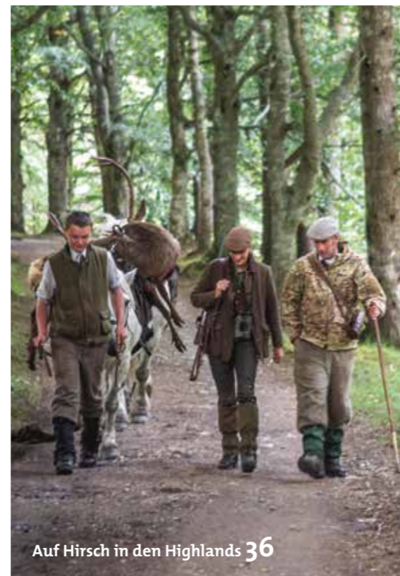
Auf Hirsch in den Highlands 36