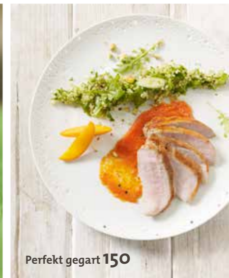
Perfekt gegart 150