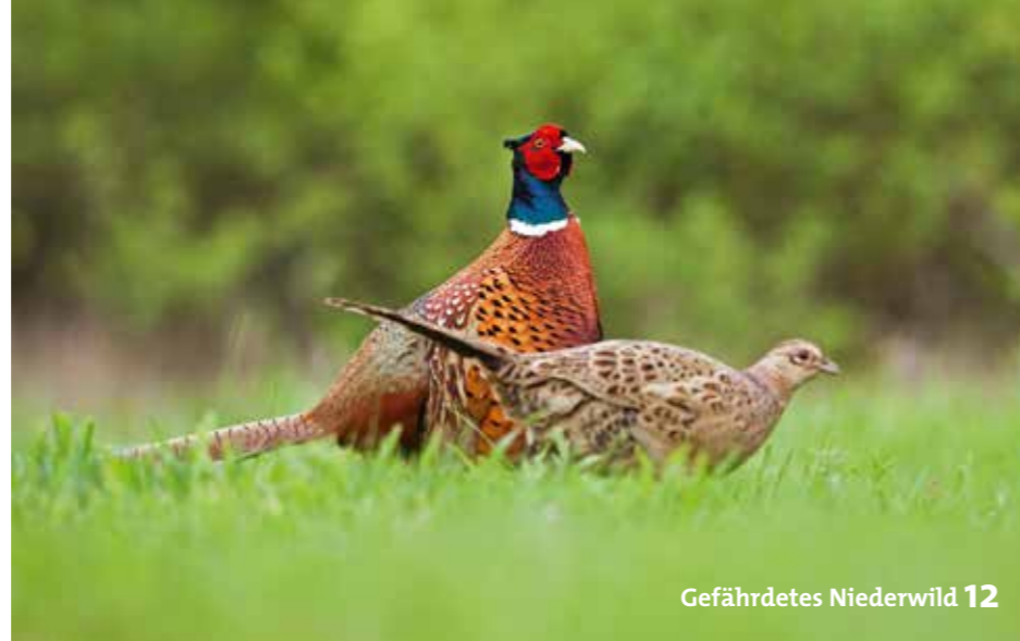
Gefährdetes Niederwild 12