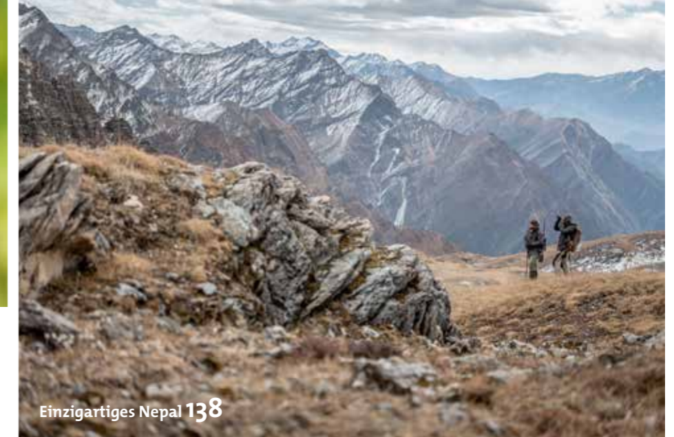
Einzigartiges Nepal 138