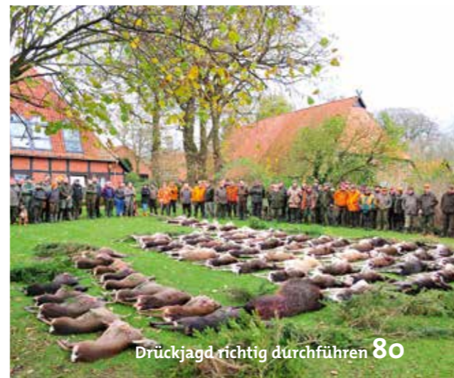
Drückjagd richtig durchführen 80