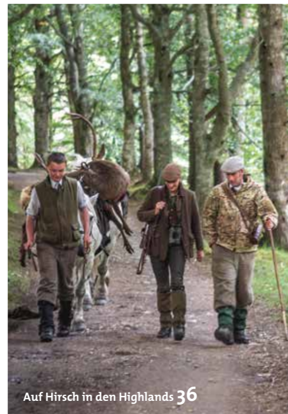
Auf Hirsch in den Highlands 36