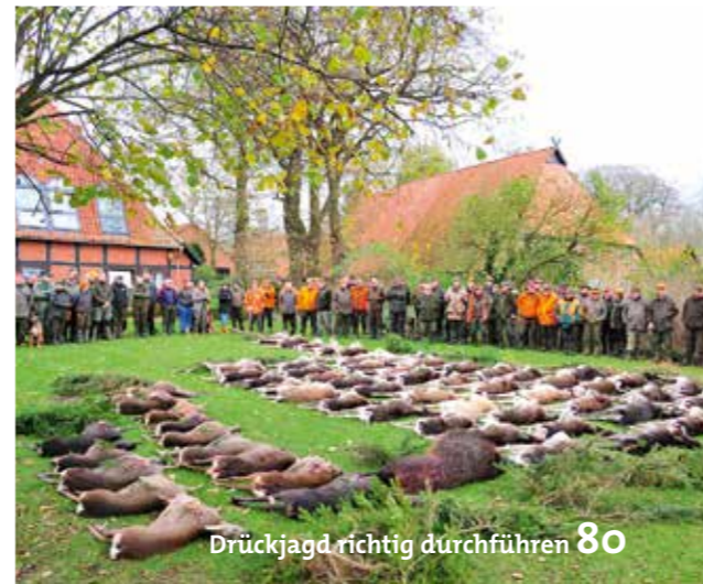
Drückjagd richtig durchführen 80