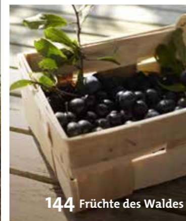
144 Früchte des Waldes