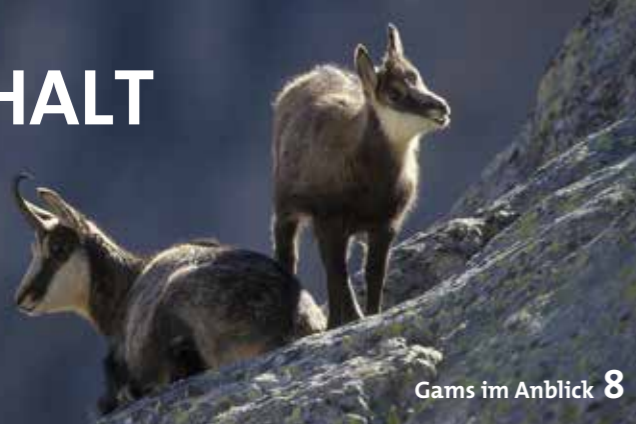
Gams im Anblick 8