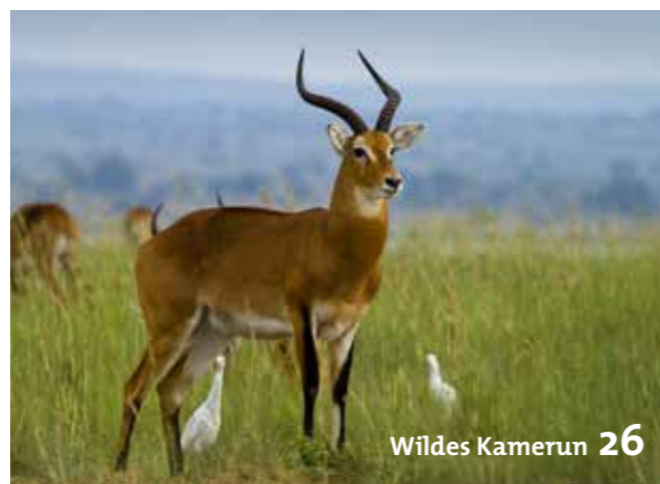
Wildes Kamerun 26