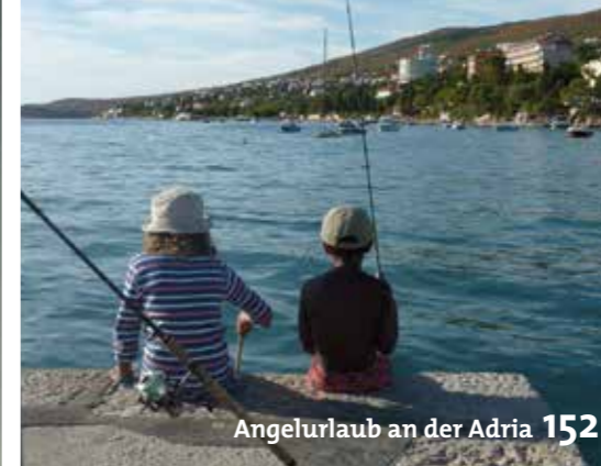
Angelurlaub an der Adria 152