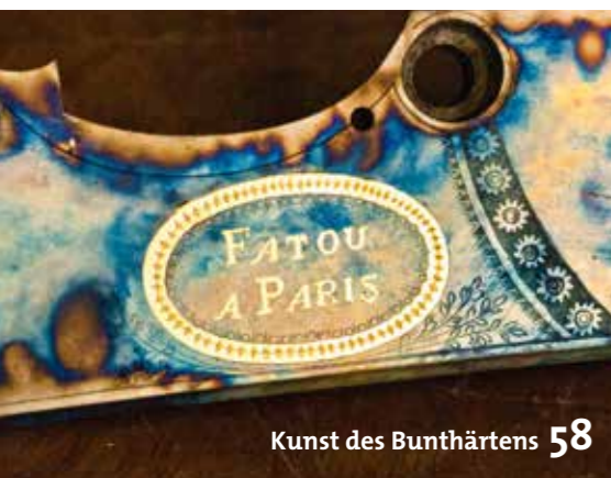
Kunst des Bunthärtens 58