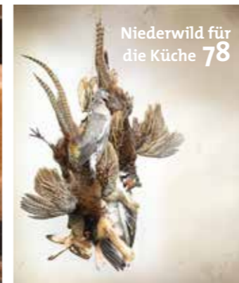
Niederwild für die Küche 78