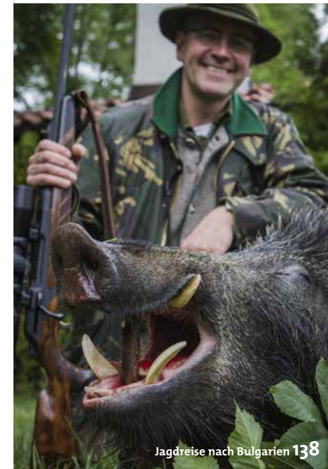
Jagdreise nach Bulgarien 138