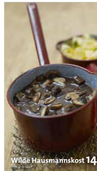
Wilde Hausmannskost 148