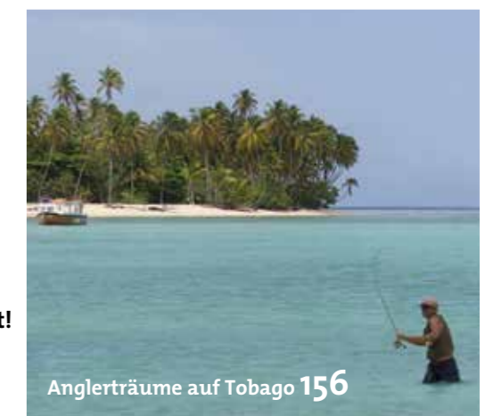
Anglerträume auf Tobago 156