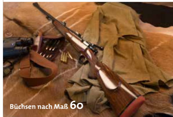
Büchsen nach Maß 60