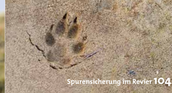
Spurensicherung im Revier 104