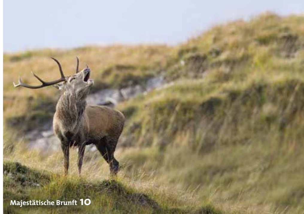
Majestätische Brunft 10