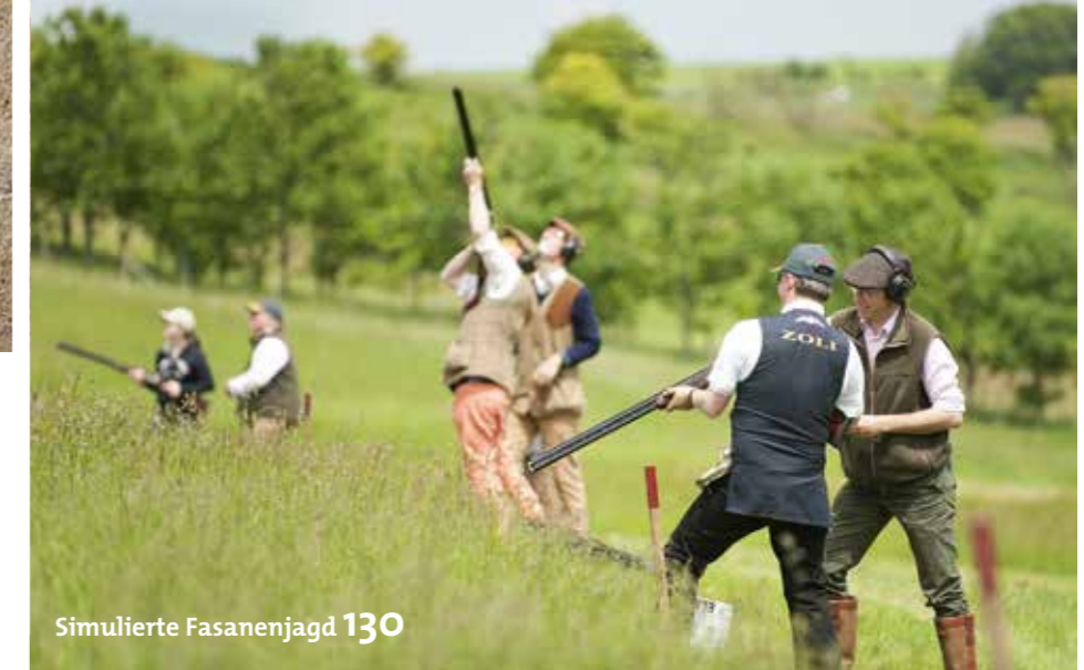
Simulierte Fasanenjagd 130