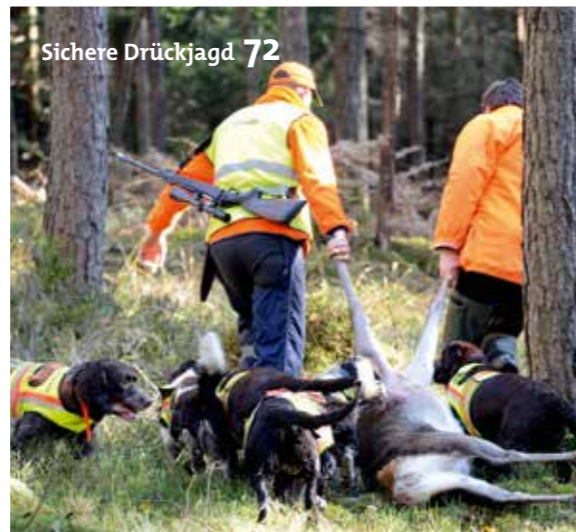
Sichere Drückjagd 72