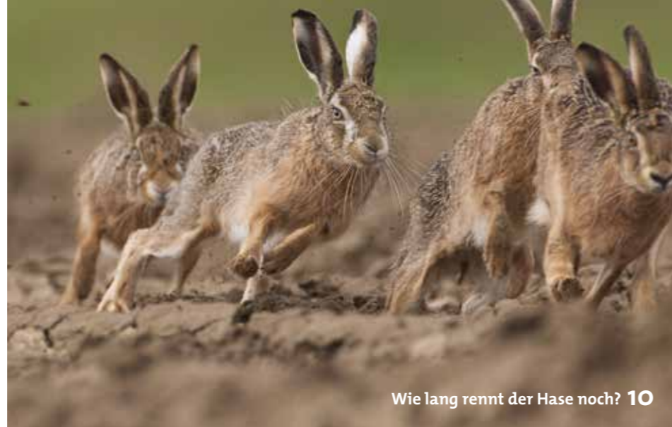
Wie lang rennt der Hase noch? 10