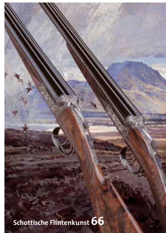
Schottische Flintenkunst 66