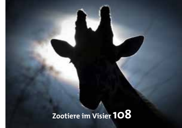
Zootiere im Visier 108