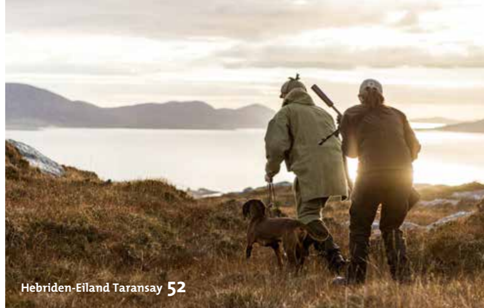
Hebriden-Eiland Taransay 52