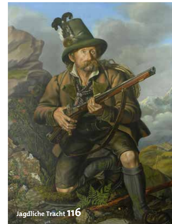
Jagdliche Tracht 116