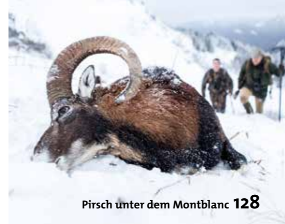
Pirsch unter dem Montblanc 128