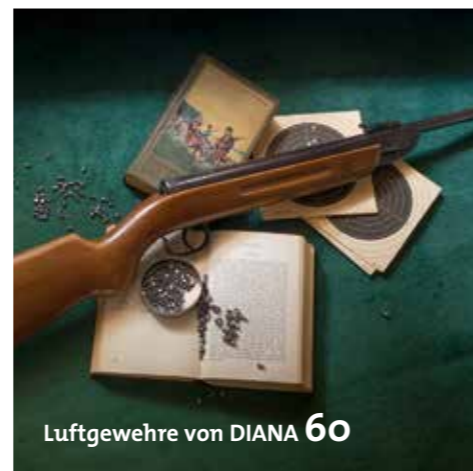
Luftgewehre von DIANA 60