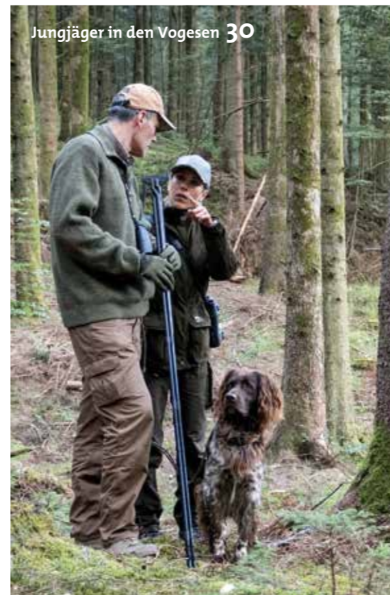
Jungjäger in den Vogesen 30

Wildkameras sind unschätzbare Revierhelfer. Tipps für den Profi-Einsatz