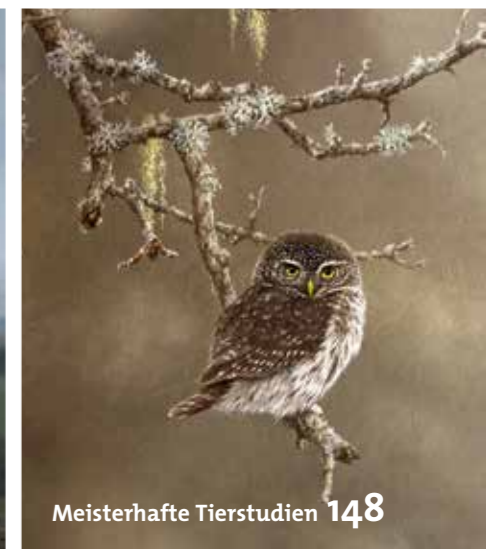
Meisterhafte Tierstudien 148