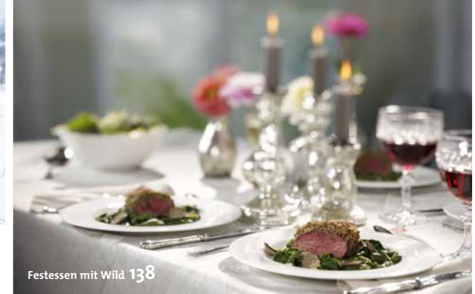
Festessen mit Wild 138