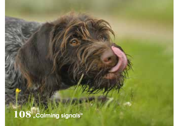
108 „Calming signals“