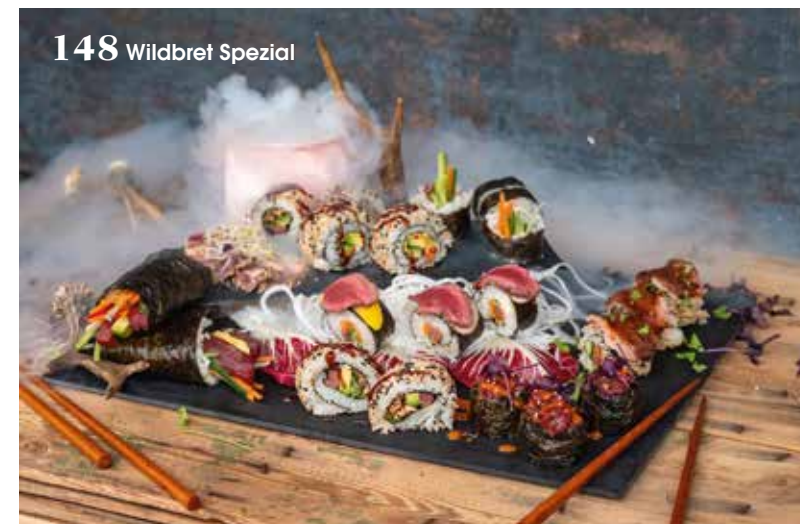
148 Wildbret Spezial