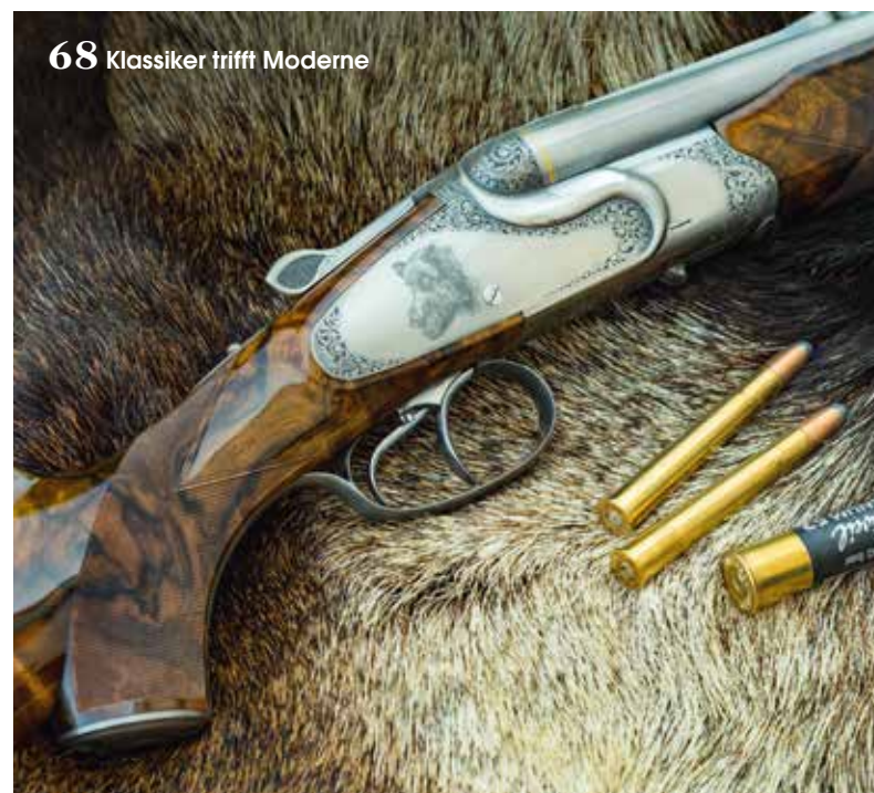
68 Klassiker trifft Moderne